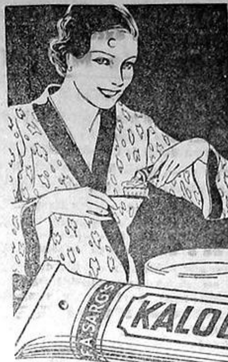
PASTA DE DINȚI SPUMOASĂ

DE VÂNZARE automobil O. kland, deschis, bună stare, rulat 45000 km., adresați batalionul Grăniceri Constanța.