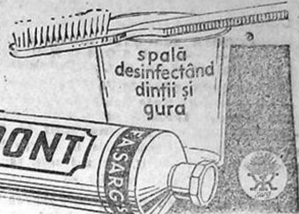
spală desinfectând dinții și gura

Spălați-vă dinții și gura cu pasta KALODONT, pasta de dinți spumoasă! Numai prin abundența spumei sale KALODONT îndepărtează din gură bacteriile și orice urmă de mâncare, permanenta primejdie a danturii! Întrebuințați deci regulat KALODONT dimineața și seara!